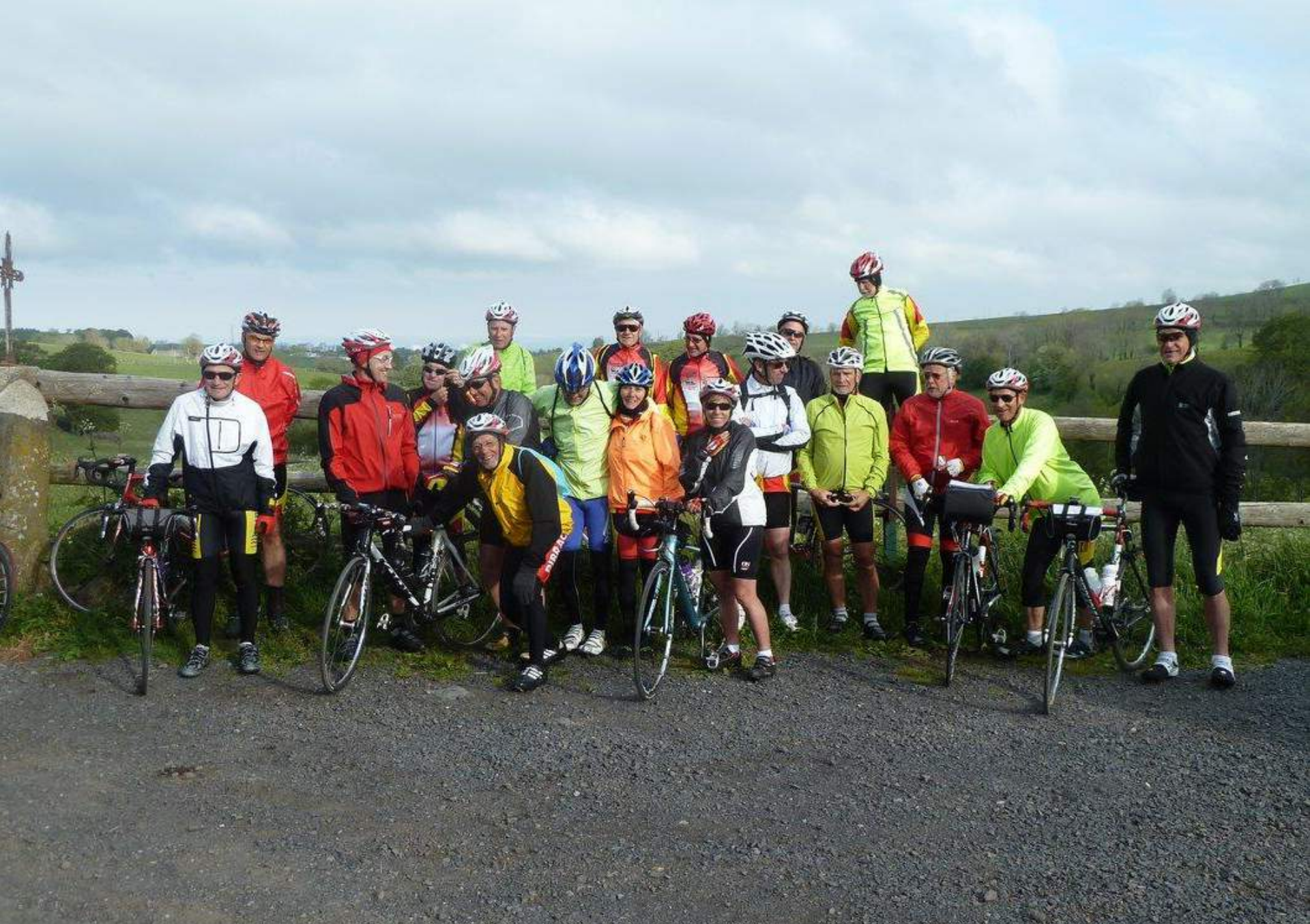
Départ de Laguiole le 31 mai au matin – Les tenues témoignent de la température « fraîche »